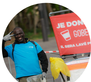
Gestion de l'eau

Bien plus qu'une course fidèle aux valeurs de Playground et de la RATP, l'événement a réaffirmé son positionnement de pionnier en matière de réduction d'impact environnemental :